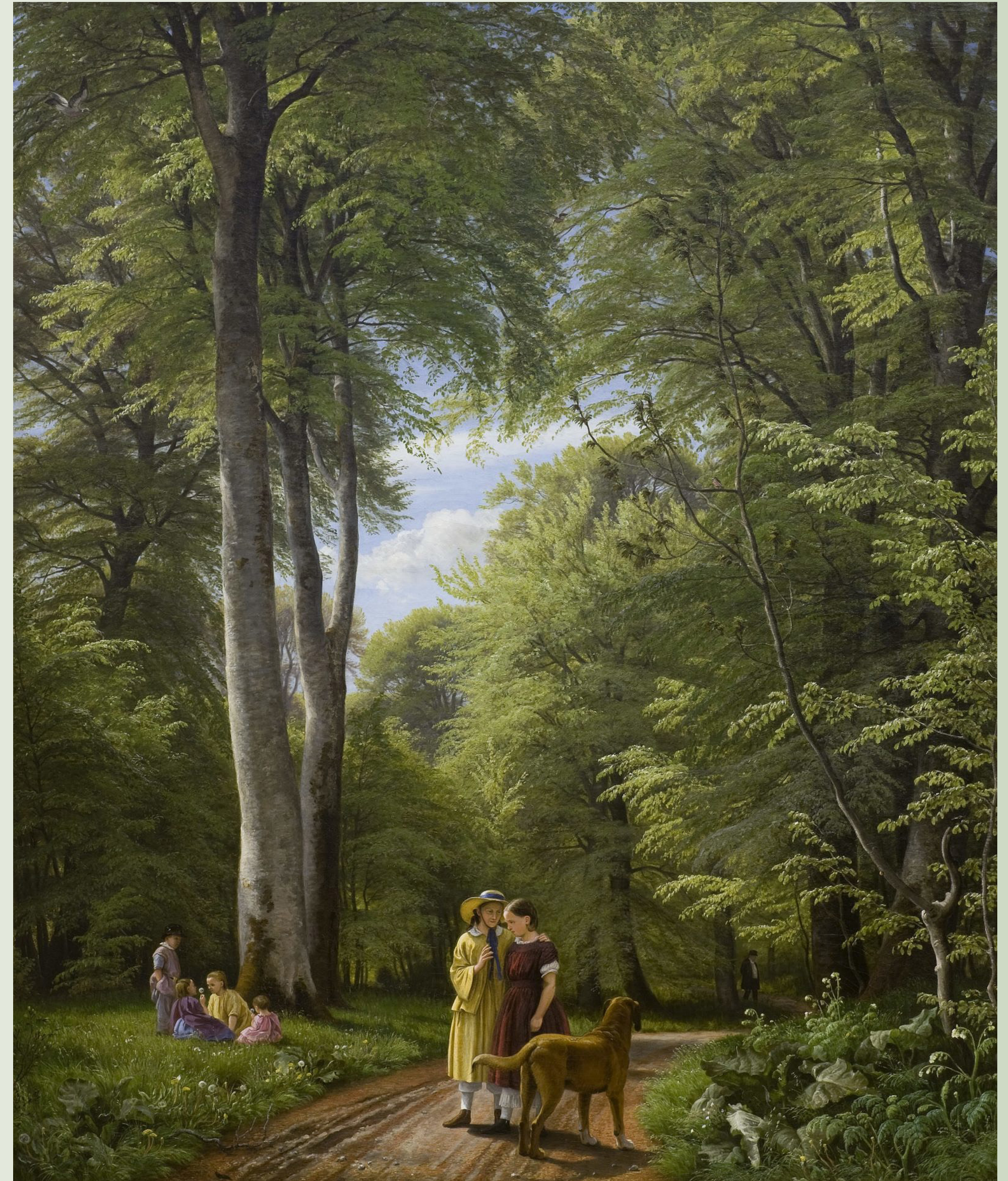
P. C. Skovgaards maleri Bøgeskov i maj fra 1857