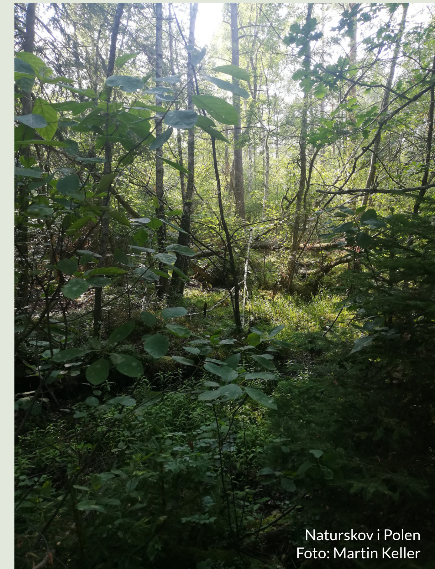
Naturskov i Polen