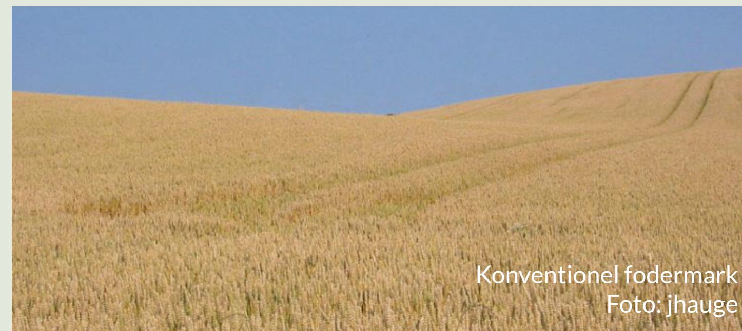
Konventionel fodermark