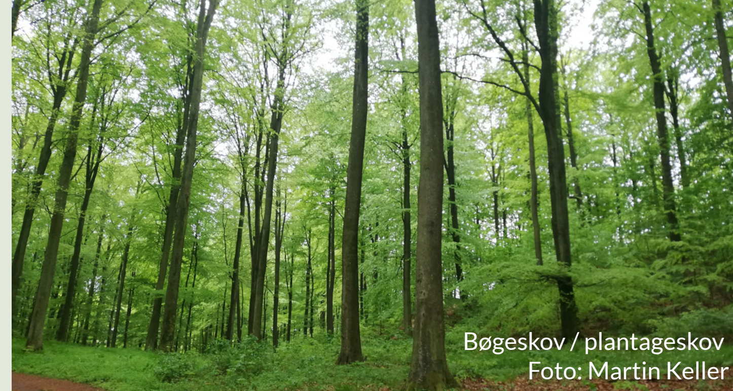
Bøgeskov / plantageskov