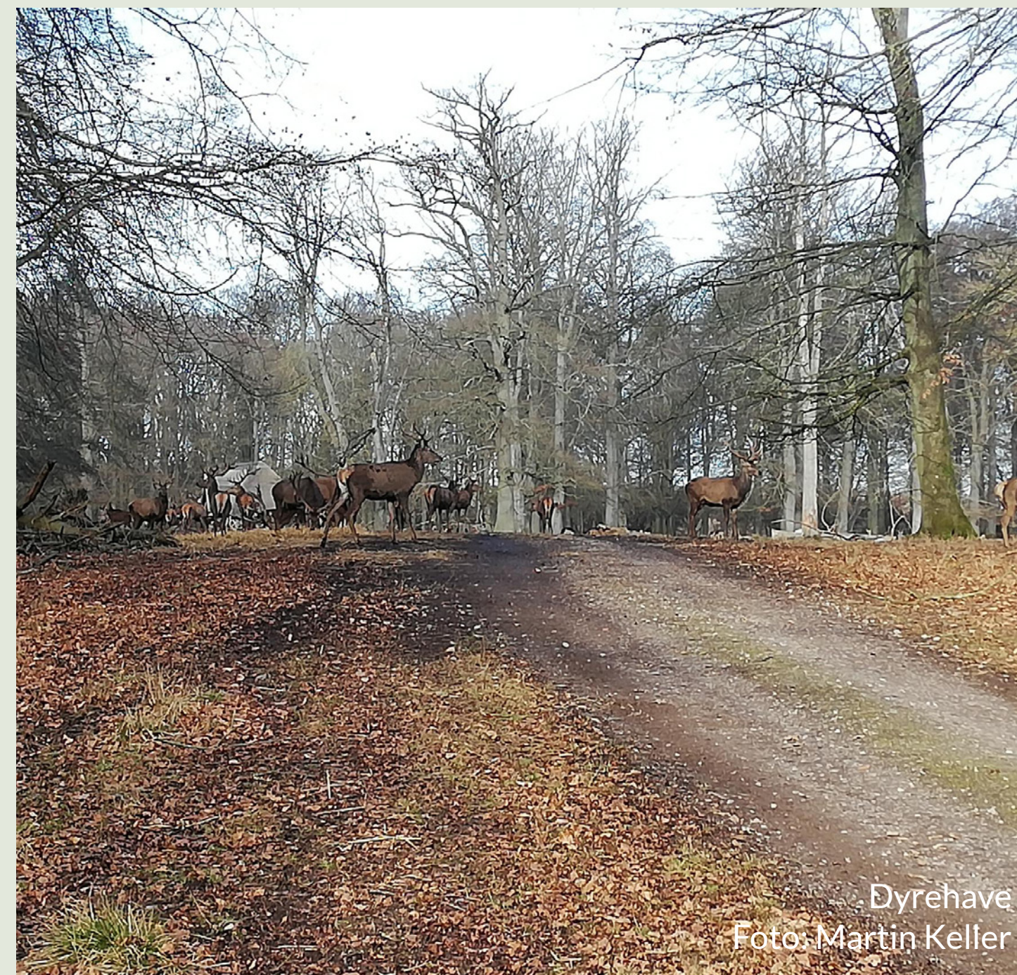
Dyrehave