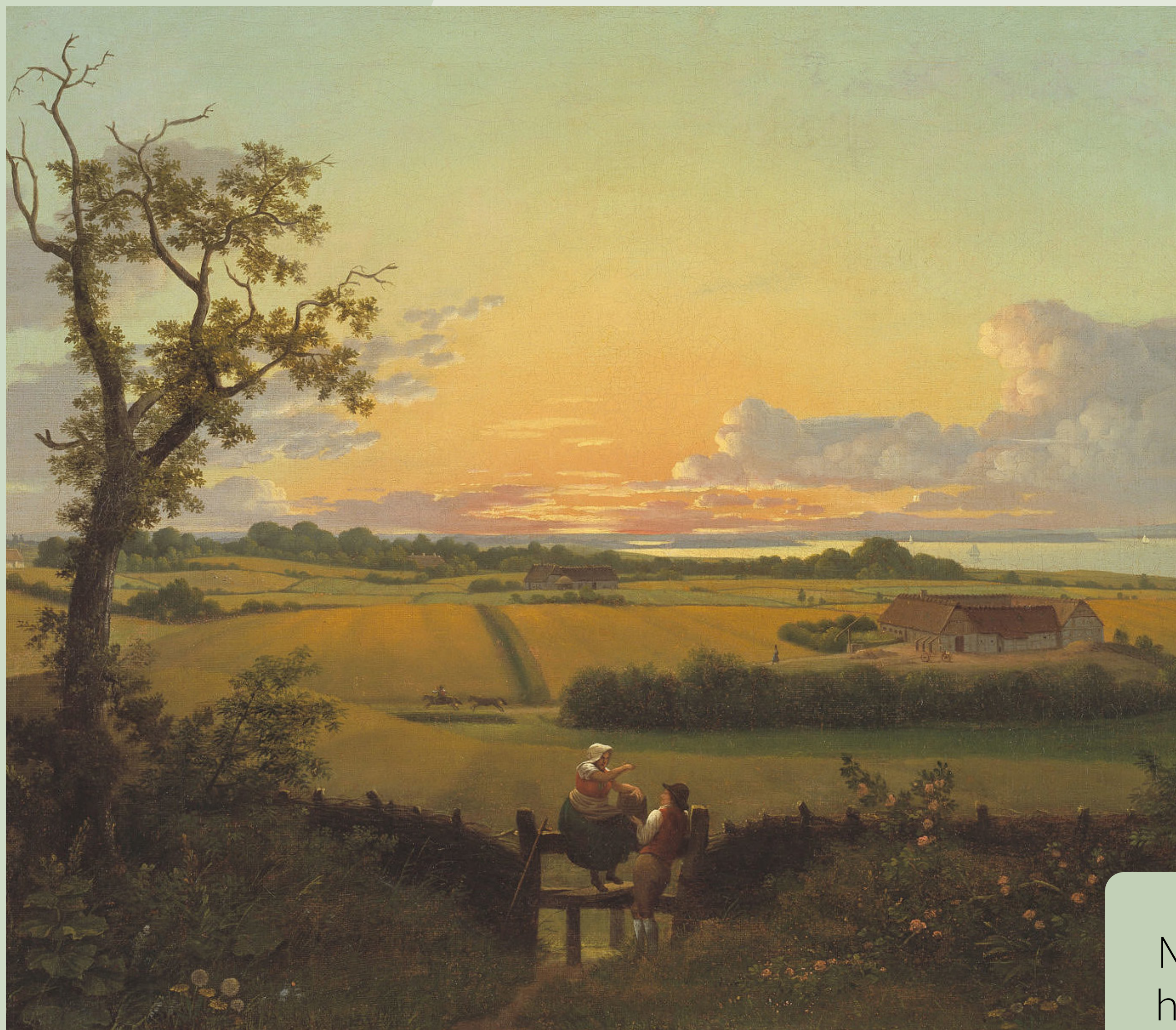
C.W. Eckersberg, Landskab i Stente, Møn, 1810